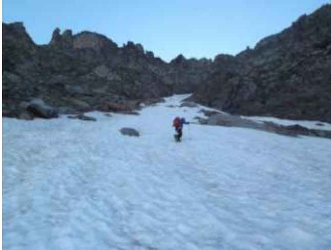
Verso l'attacco del canale