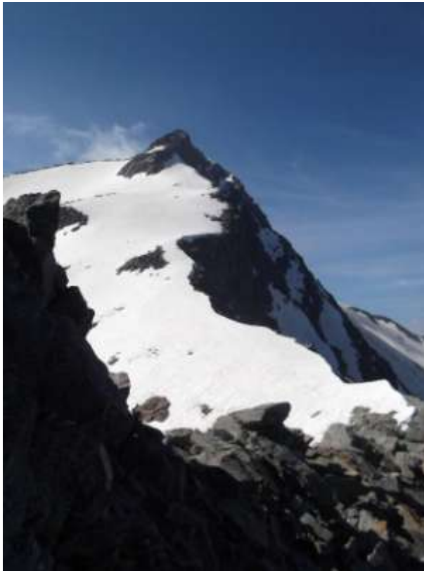
Cresta all'uscita dal canale