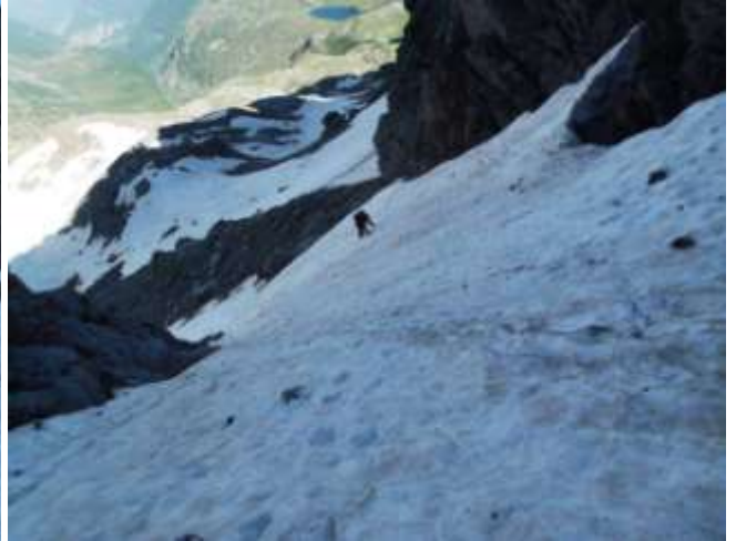
Nel canale Federica