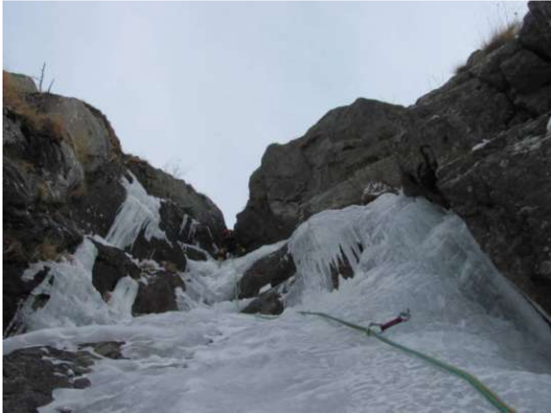
Terzo tiro (Foto Febbraio 2012)