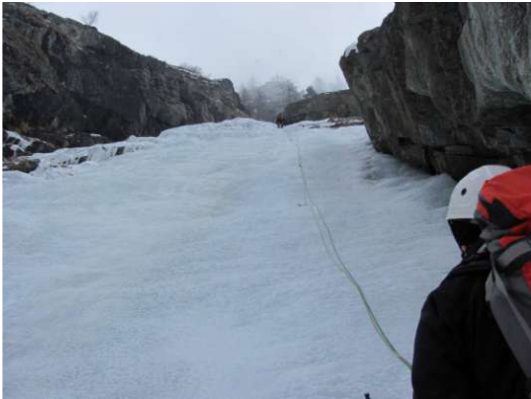
Primo tiro (Foto Febbraio 2012)