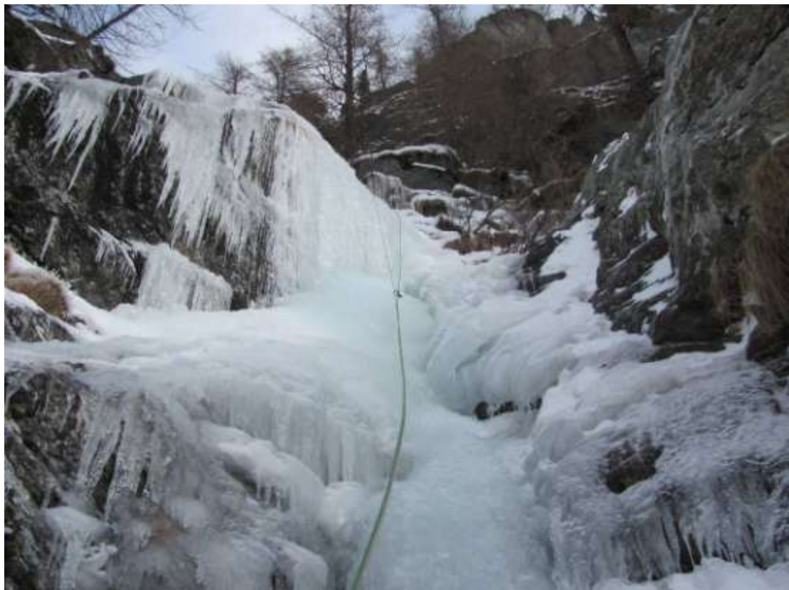
Quarto tiro (Foto Febbraio 2012)