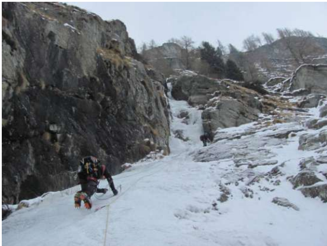
Secondo tiro (Foto Febbraio 2012)