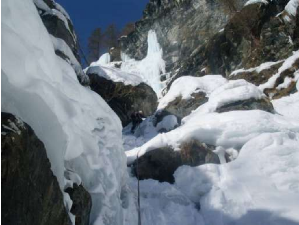
Quarto tiro tranquillo (Foto marzo 2010)