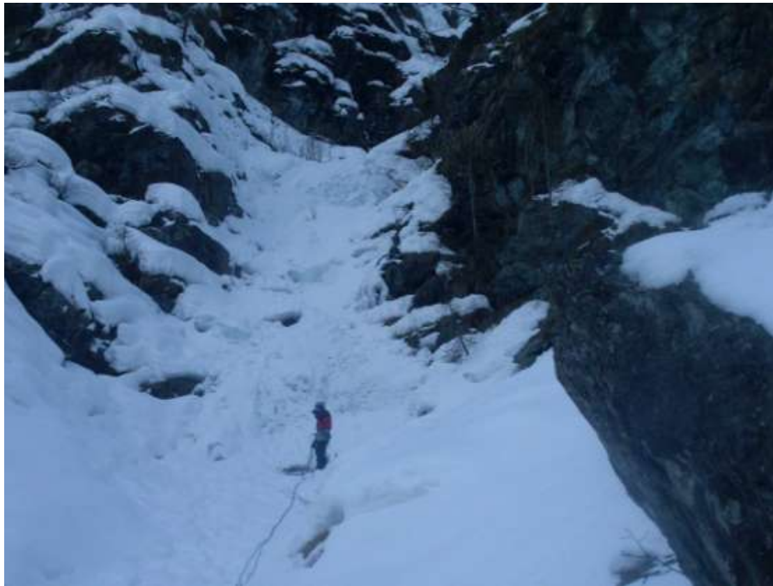
Fine del primo tiro e attacco del secondo (Foto marzo 2010)