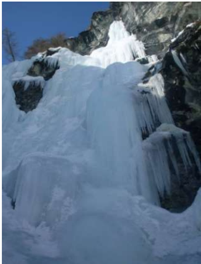
Quinto tiro a sinistra e a destra (Foto marzo 2010)