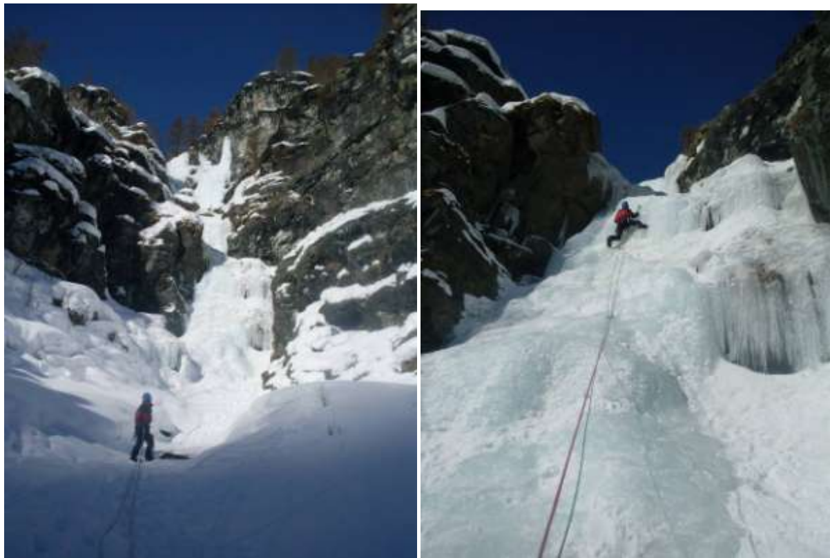
Terzo tiro (Foto marzo 2010)