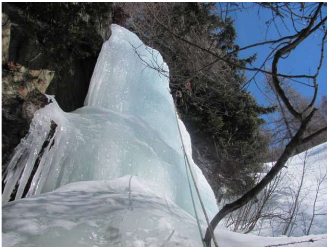
Candelina finale del terzo tiro (Foto Marzo 2013)