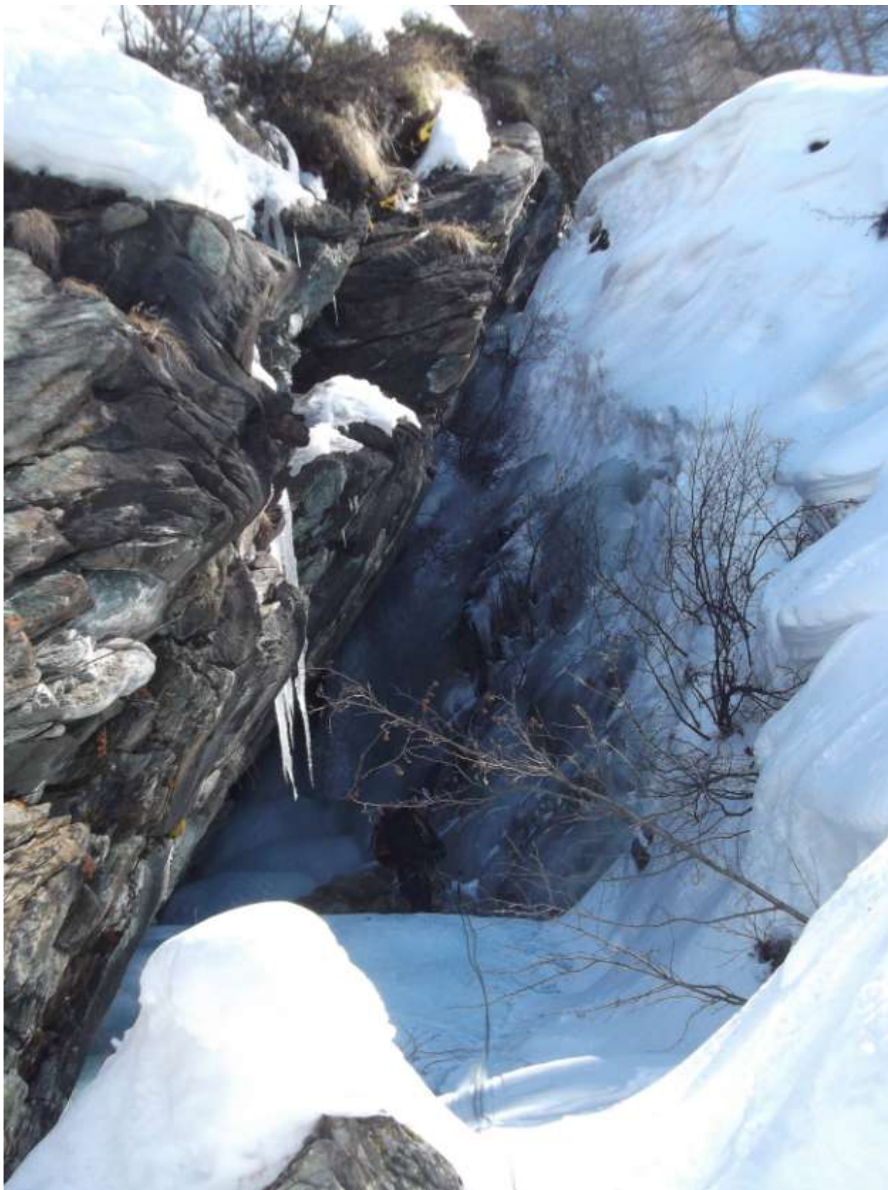
Terzo tiro nella forra (Foto Marzo 2013)