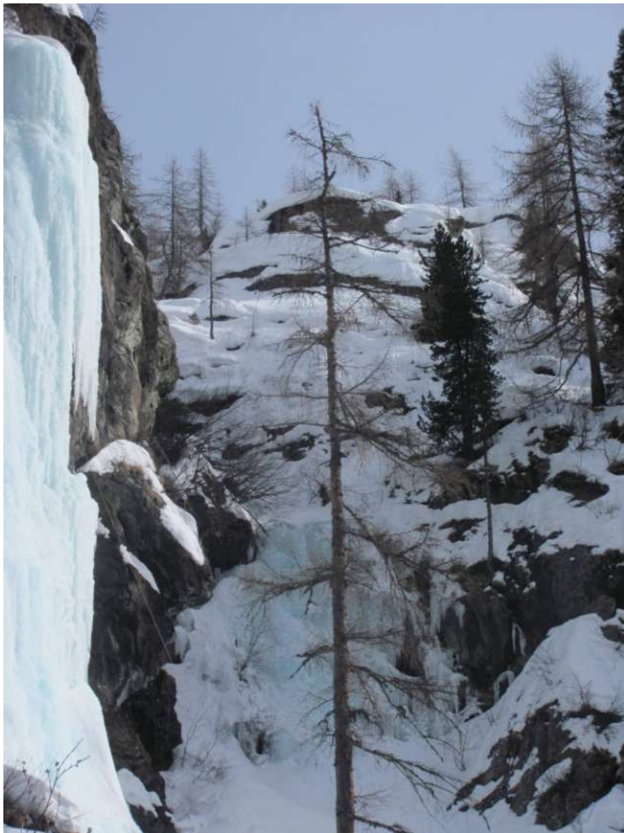
Primo tiro della cascata (Foto Marzo 2013)