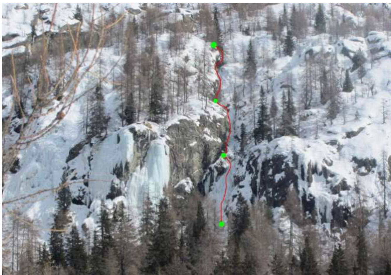
La linea di salita, le soste in verde (Foto Marzo 2013)