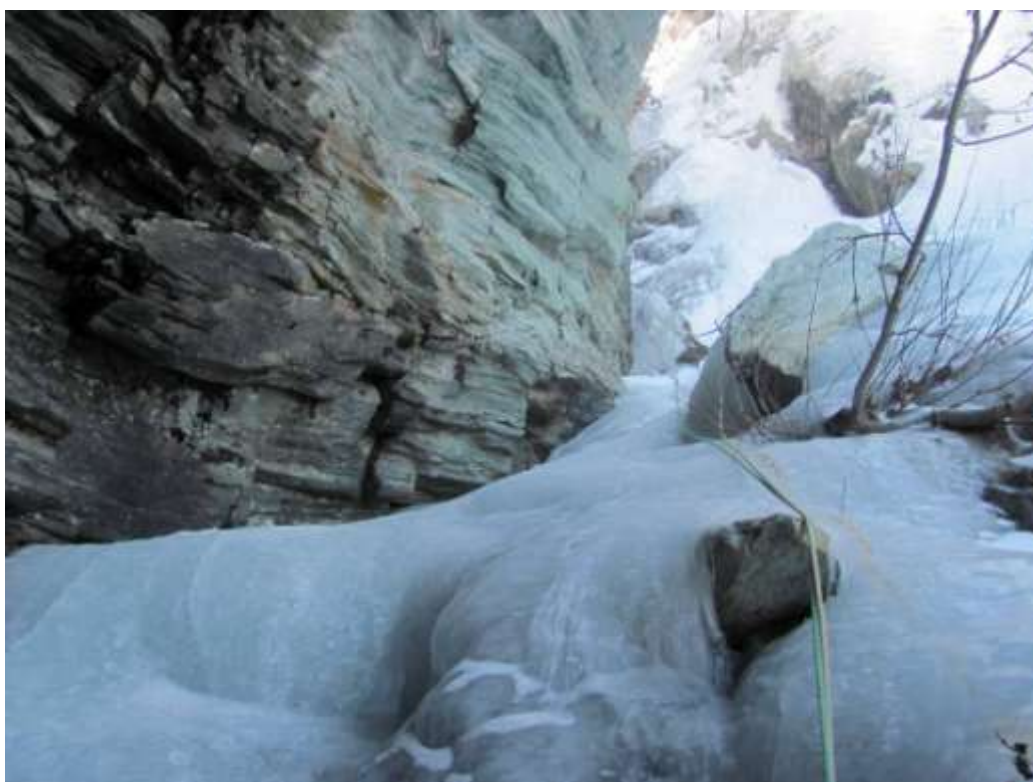
Secondo tiro della cascata (Foto Marzo 2013)