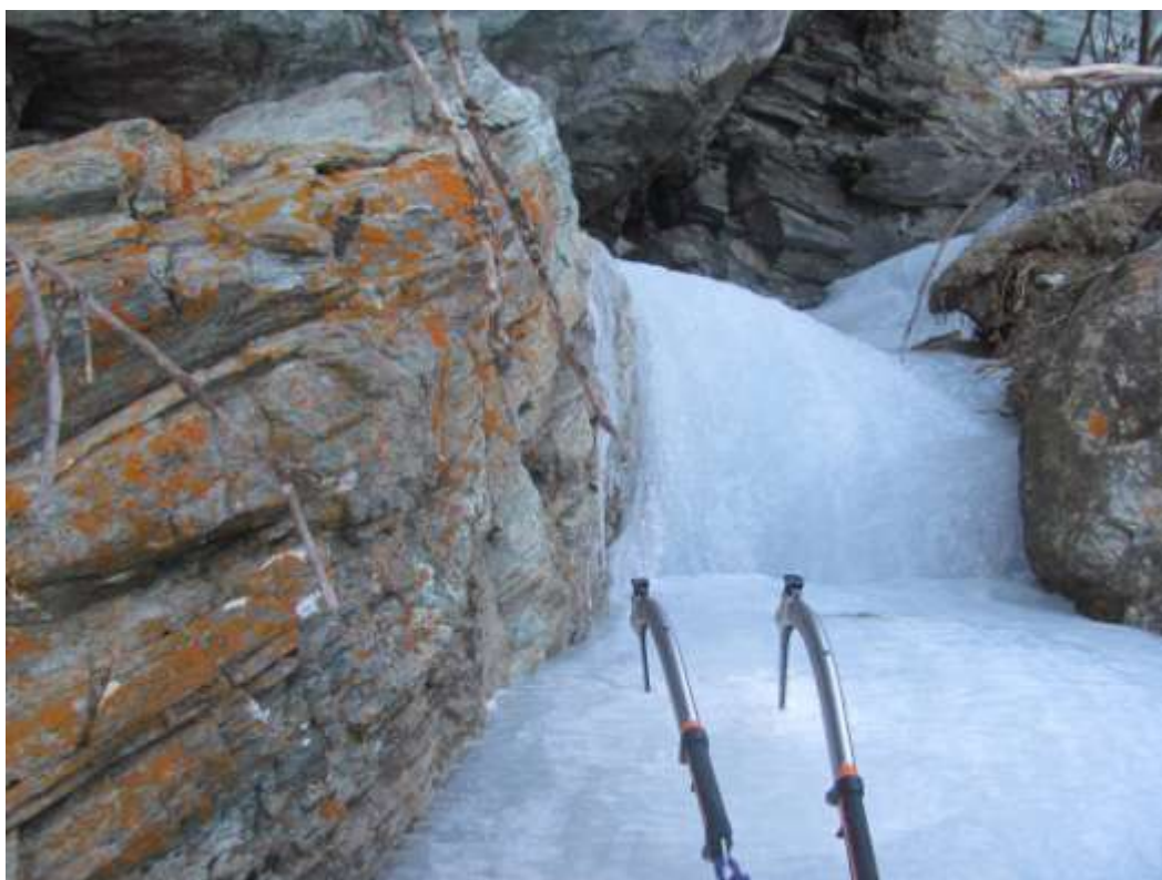
Secondo tiro della cascata (Foto Marzo 2013)