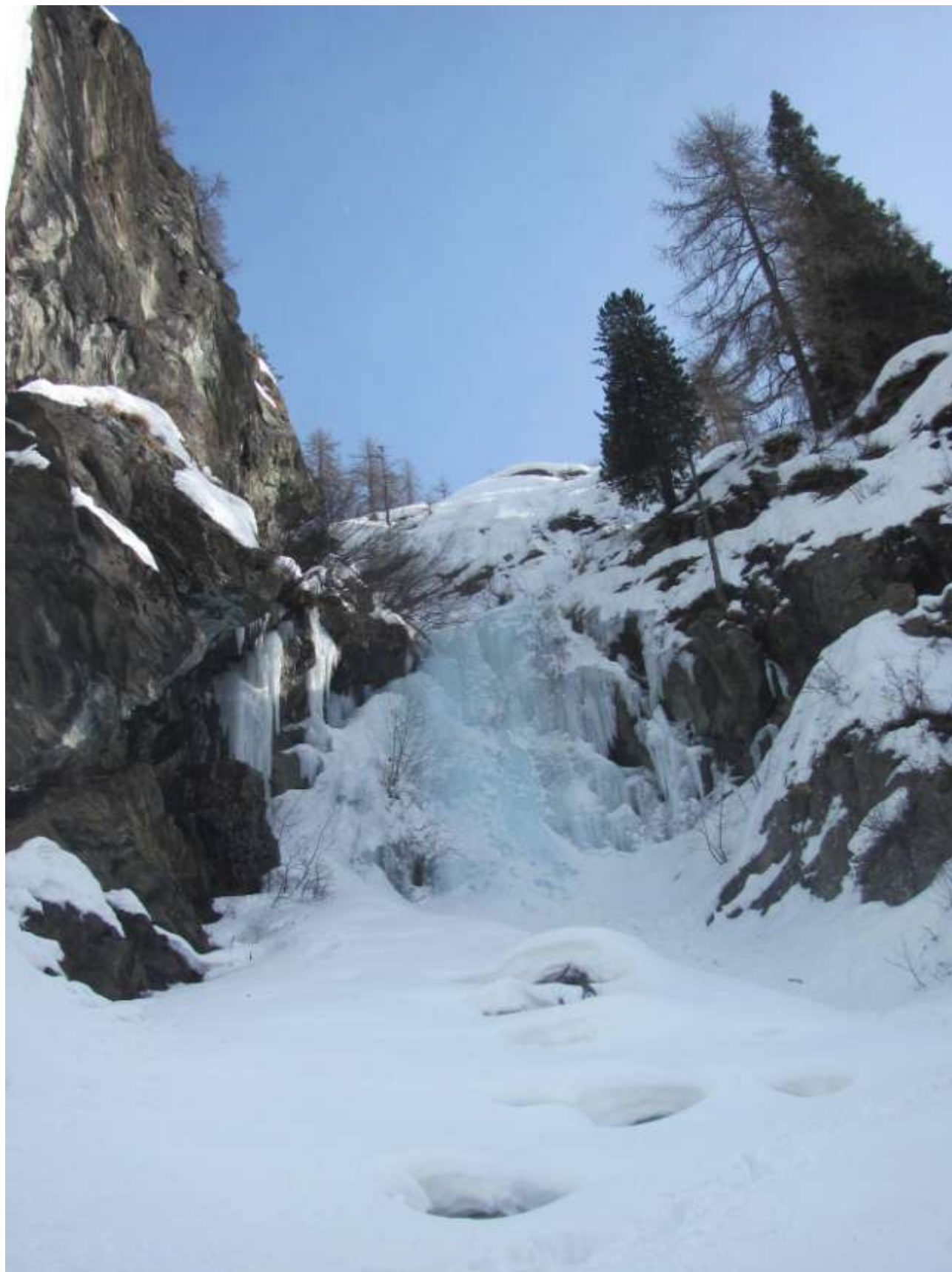
Primo tiro della cascata (Foto Marzo 2013)