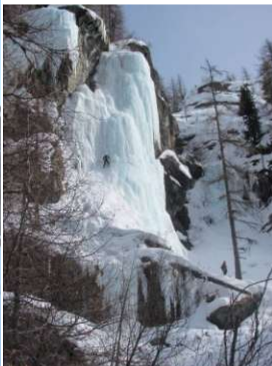
Parte cantrale del Castello (Foto Marzo 2013)