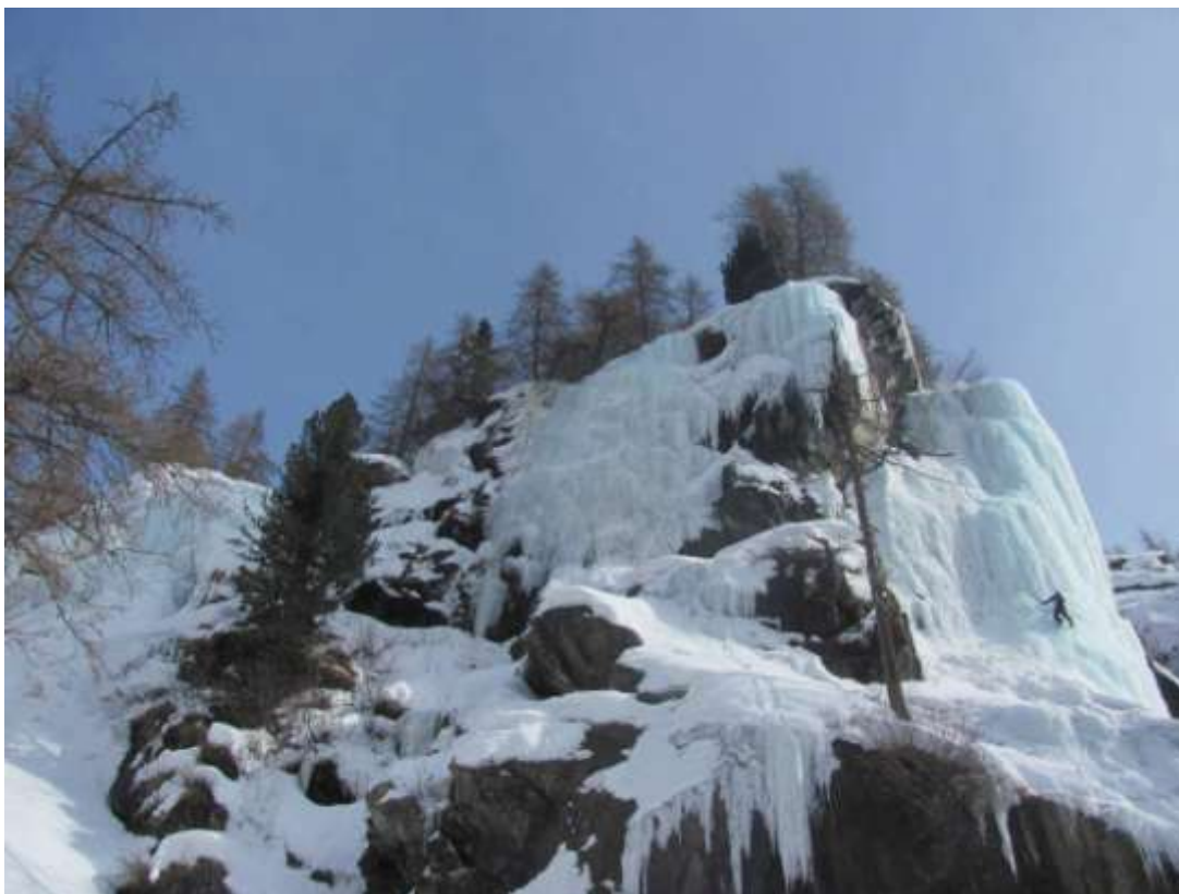
Parte cantrale del Castello (Foto Marzo 2013)