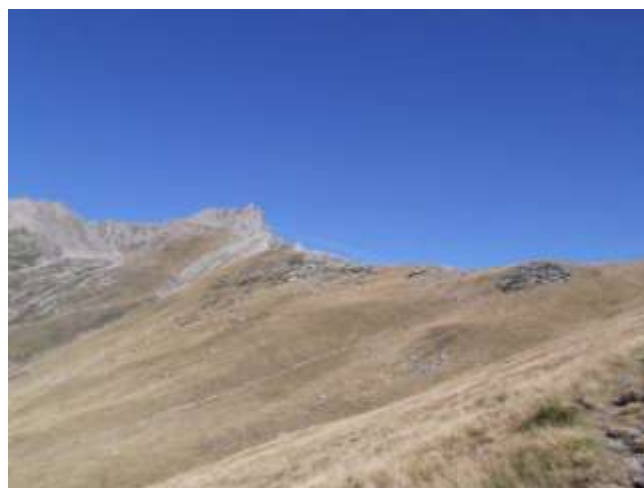
Nei prati seguendo la traccia