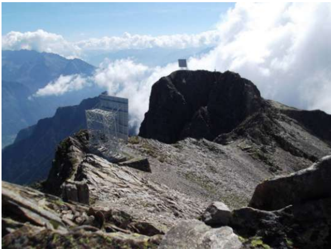
Vista dalla cima del Sasso Canale