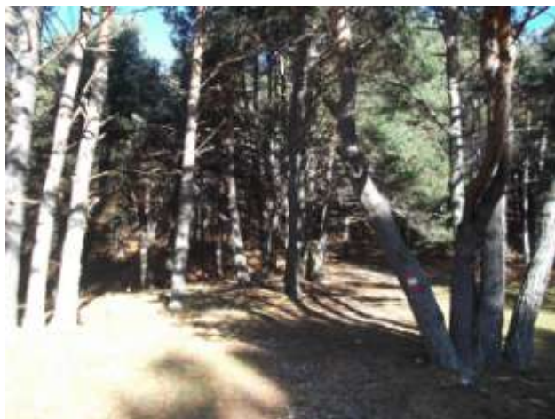
Sentiero nel bosco