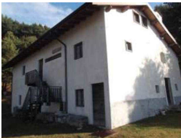
La Chiesa di S. Bartolomeo