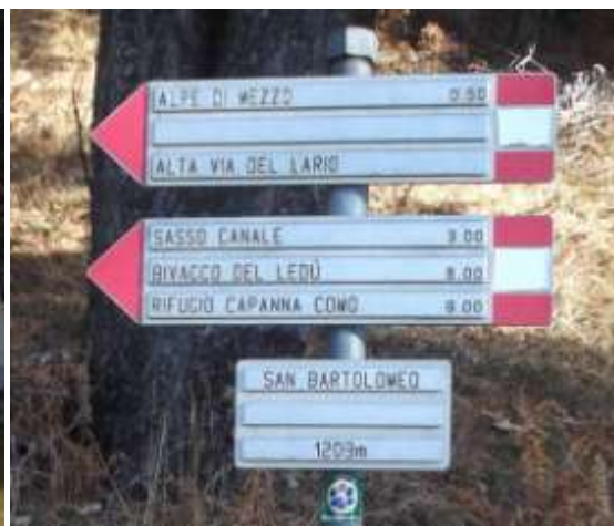
I cartelli dei sentieri