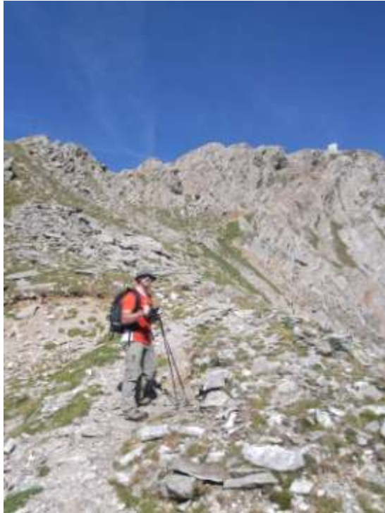
Sentiero piu' roccioso