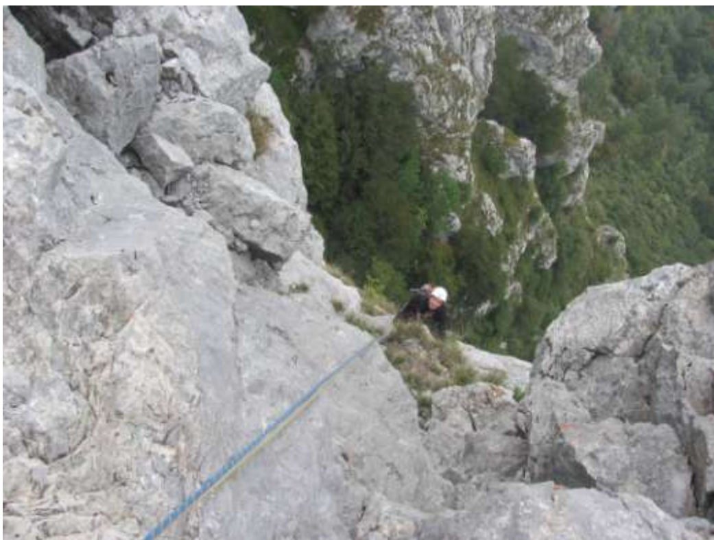
Ultimo tiro (visto dall'alto)