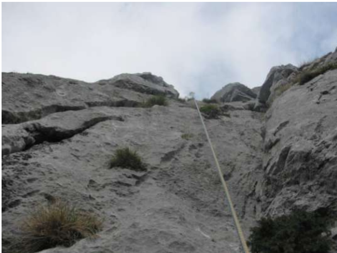
Ultimo tiro (visto dal basso)