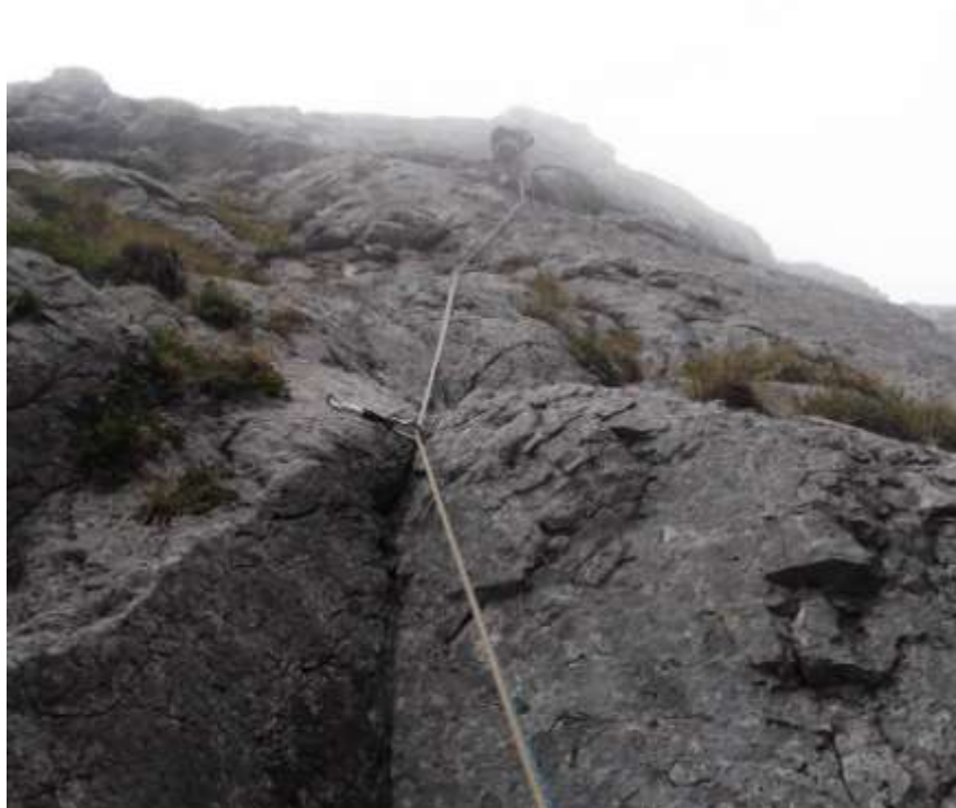
Secondo tiro , prima del passaggio duro