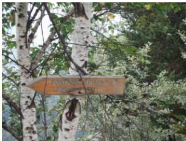
Cartello del sentiero che parte dalla Bocchetta