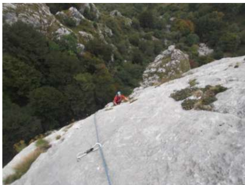
Terzo tiro (visto d'alto)