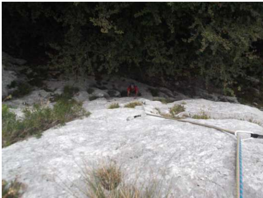
Primo tiro (vista dall'alto)