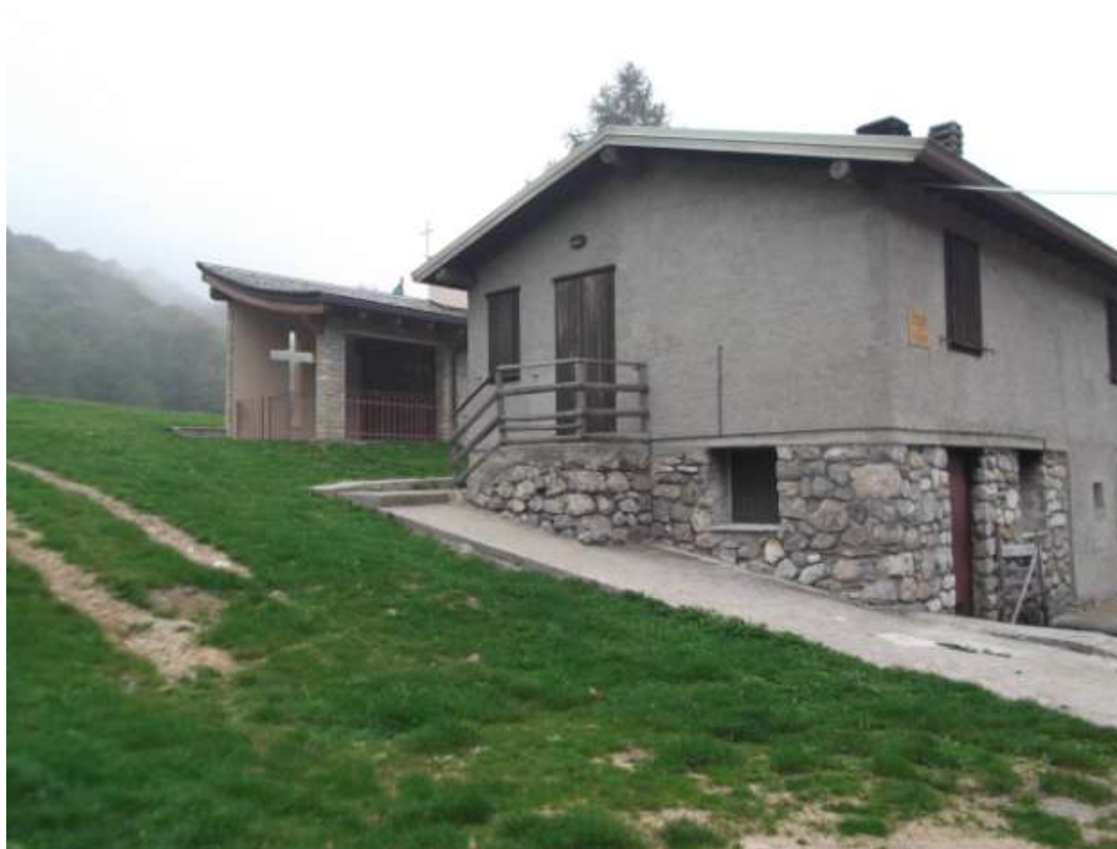
Rifugio sul percorso