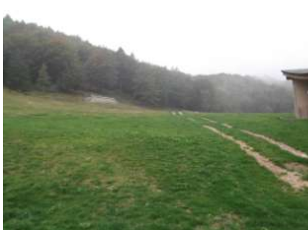
Sentiero a lato chiesetta