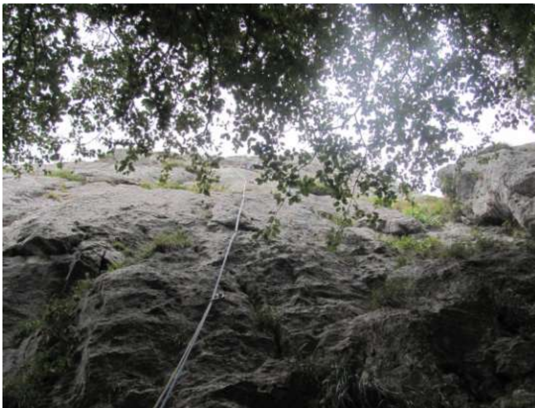
Primo tiro (vista dal basso)