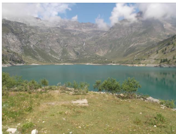
Lago di Cignana