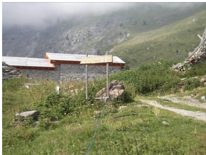
Case di Cortina