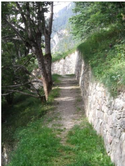
Sentiero zona Mont-Menè