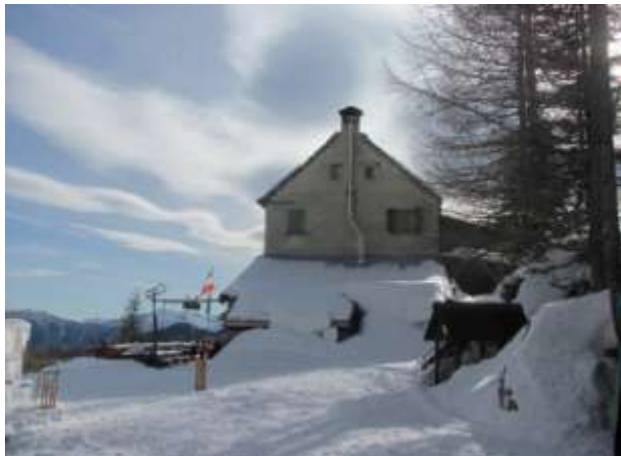
Il rifugio crosta