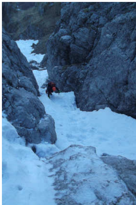
Primi salti ricoperti di neve