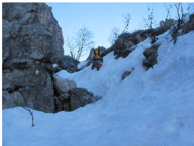
A metà canale