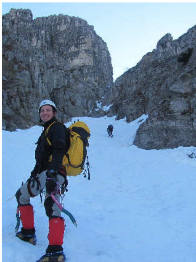
Attacco al canale