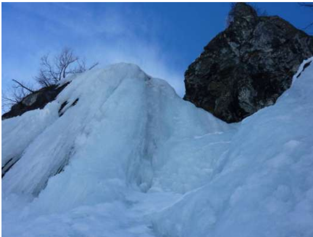
Sotto la candela (Foto Gennaio 2011)