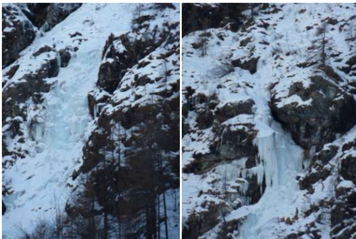
Primo e terzo tiro (Foto Gennaio 2011)