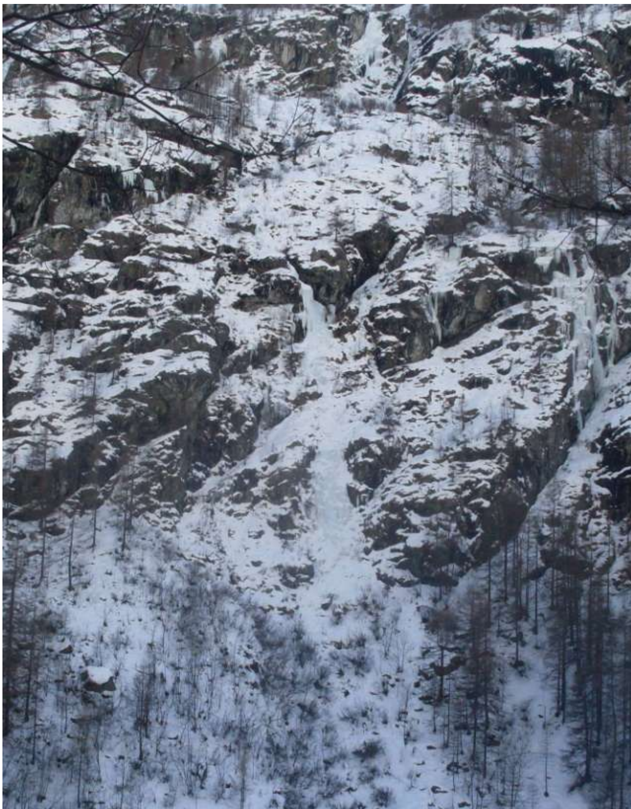
Cascata vista dal parcheggio con al centro la candela (Foto Gennaio 2011)